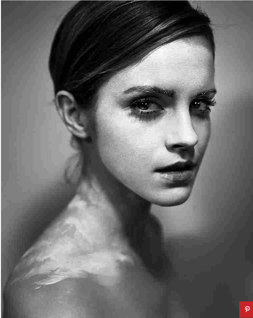
Emma Watson, Londra, 2012